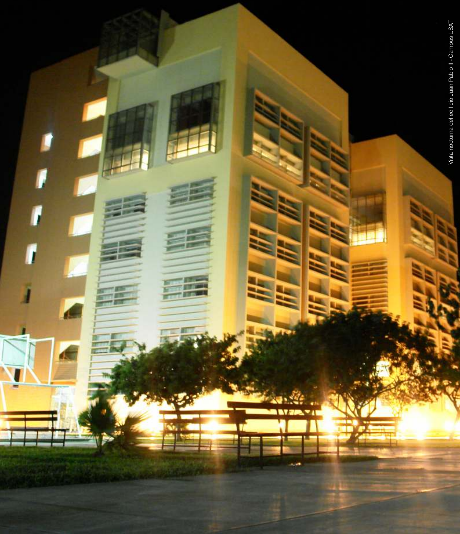
Vista nocturna del edificio Juan Pablo II - Campus USAT