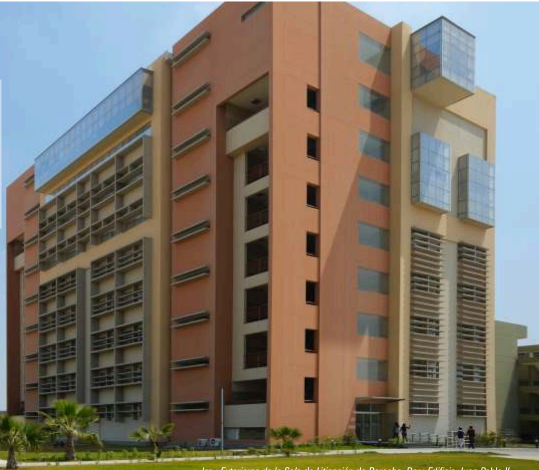
Izq.: Exteriores de la Sala de Litigación de Derecho. Der.: Edificio Juan Pablo II.

La infraestructura de la USAT ha sido concebida para cubrir todos los requerimientos necesarios para el desarrollo personal y profesional de sus estudiantes, brindándoles los ambientes y laboratorios más modernos del medio, equipados con tecnología de punta, que vayan acorde con la filosofía universitaria.